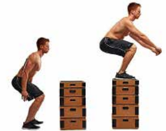
SALTO A CAJÓN