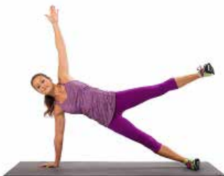
PLANCHA LATERAL (2)