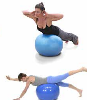
LUMBARES FITBALL 3 X 10