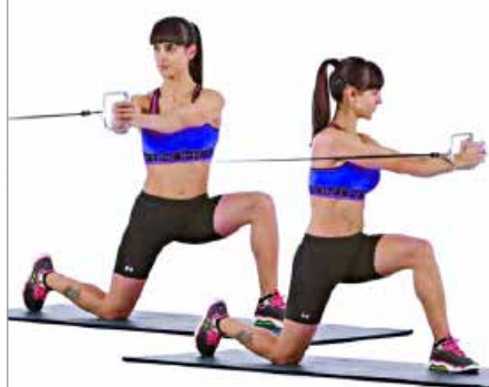
ROTACIONES POLEA O GOMA 3 x 10 x LADO