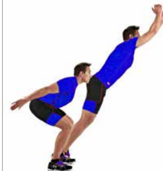
SALTO HORIZONTAL 6 x 6