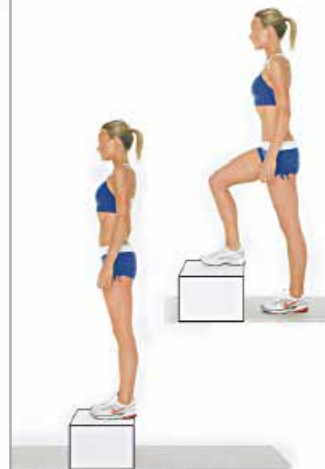
SUBIDAS CAJÓN 2 x 10 por pierna