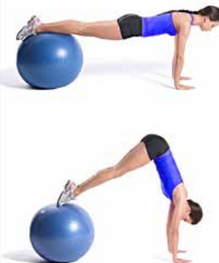
ABS FITBALL 3 x 10