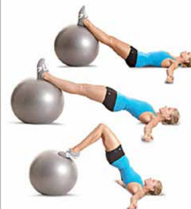
PELVIC CURL 3 x 10