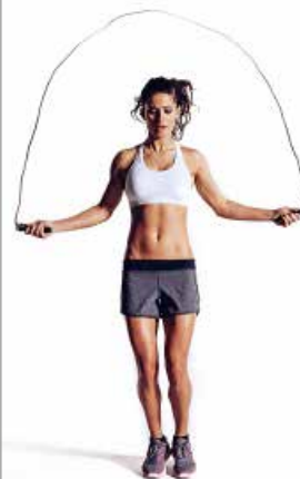
COMBA 5 x 40"/20"