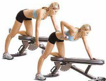
REMO 1 MANO 2 x 10 x mano