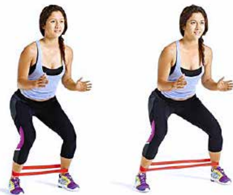
PASOS LATERALES GOMA 2 X 10 X LADO