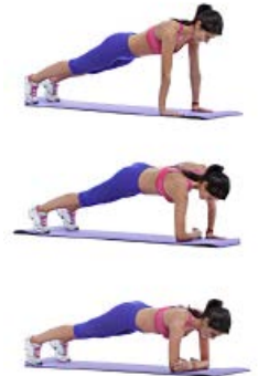
CAMBIO APOYOS 2 x 12