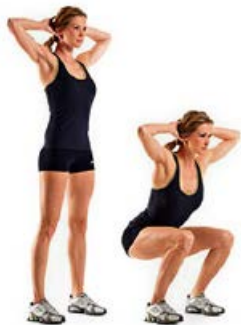
SENTADILLA 2 x 12