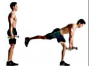
PESO MUERTO UNA PIERNA 2 x 12