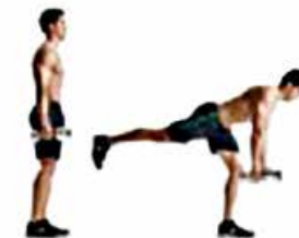
PESO MUERTO UNA PIERNA 2 x 12