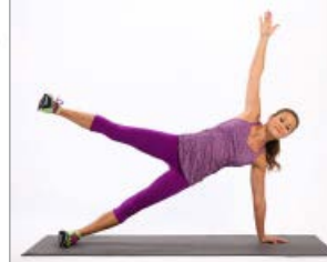
PLANCHA LATERAL (1)