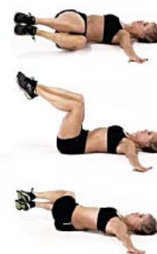
OBLICUOS 2 x 10 por lado