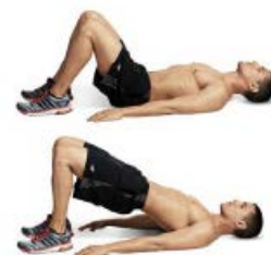
PUENTE HOMBROS 2 x 12 por pierna