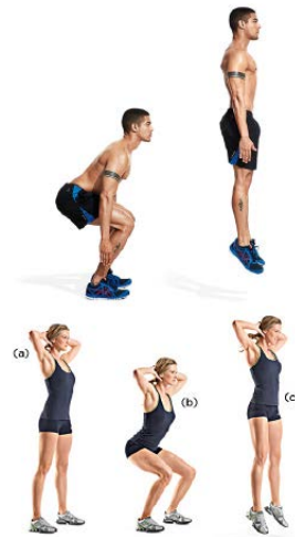
SENT. MULTISALTO 4 X 8