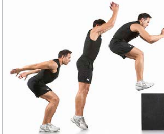
SALTOS A CAJAN 5 X 5