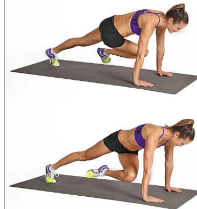
RODILLAS AL PECHO 3 X 6