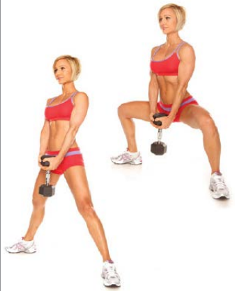
SENTADILLA SUMO 3 X 8