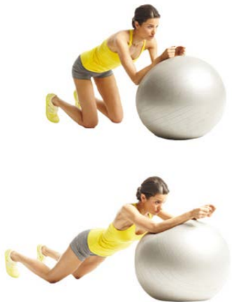
ABS FITBALL 3 X 7