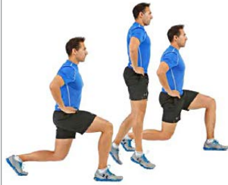
SPLIT MULTISALTO 4 X 10