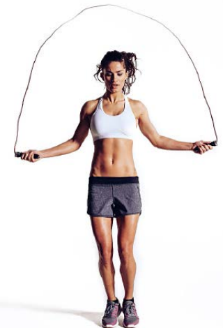
COMBA 8 X 30"/15"