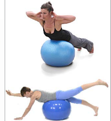
LUMBARES FITBALL 3 X 8