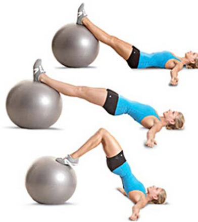
PELVIC CURL 3 X 7