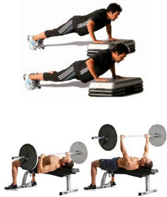
FONDOS O PRESS 4 X 8