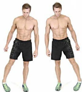
TOBILLOS 10" por pie y sentido