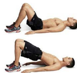
PUENTE HOMBROS 2 x 8 por pierna