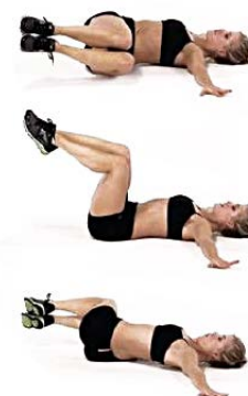
OBLICUOS 2 x 10 por lado