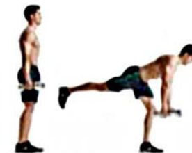
PESO MUERTO UNA PIERNA 2 x 8