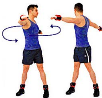
CINTURA CADERA 15" por sentido