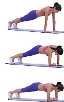
CAMBIO APOYOS 2 x 8