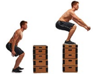
SALTO A CAJÓN