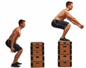
SALTO A CAJÓN