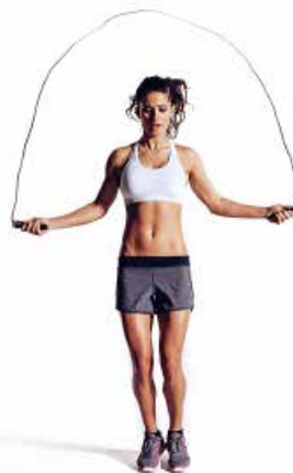
COMBA 5 x 40"/20"