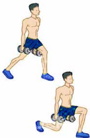
SPLIT 2 x 10 x pierna