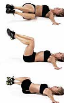
OBLICUOS 2 x 15 por lado