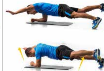
PLANCHA 2 x 20"