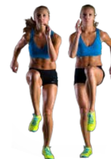
SKIPPING 3 x 20"