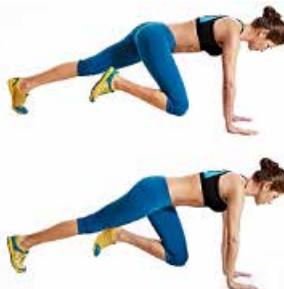
CLIMBER 2 x 16