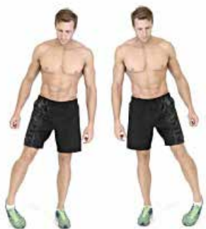
TOBILLOS 10" por pie y sentido