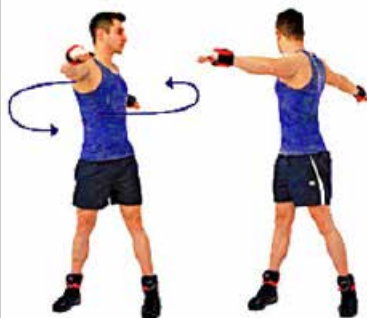
CINTURA CADERA 15" por sentido