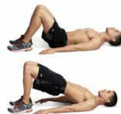
PUENTE HOMBROS 2 x 12 por pierna