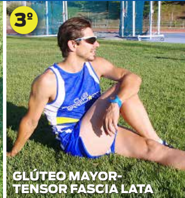
GLÚTEO MAYOR- TENSOR FASCIA LATA