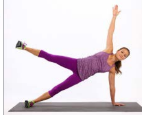
PLANCHA LATERAL (1)