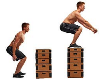
SALTO A CAJÓN