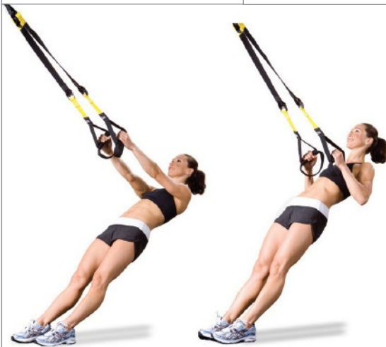
REMO TRX o JALÓN 3 x 10