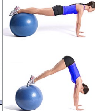
ABS FITBAL 3 x 10