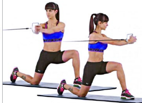
ROTACIONES POLEA O GOMA 2 x 10 x LADO