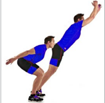
SALTO HORIZONTAL 5 x 6