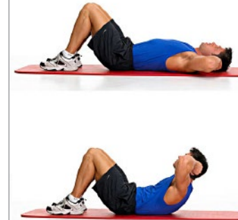
ABDOMINALES 3 x 20