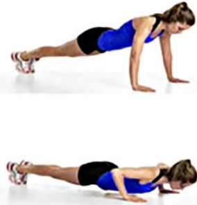
FONDOS 3 x 10