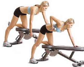
REMO 1 MANO 2 x 10 x mano