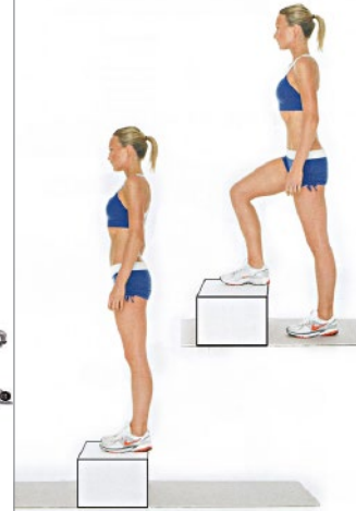
SUBIDAS CAJÓN 2 x 10 por pierna