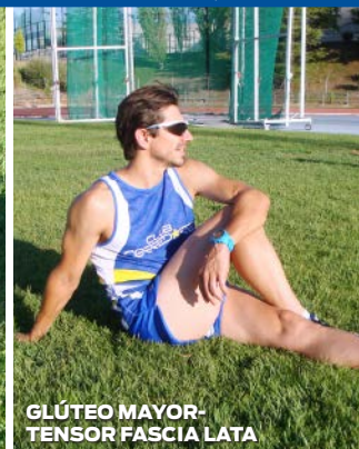
GLÚTEO MAYOR-TENSOR FASCIA LATA