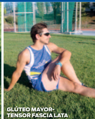
GLÚTEO MAYOR-TENSOR FASCIA LATA