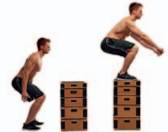
SALTO A CAJÓN