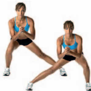
SIDE TO SIDE