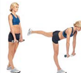
PESO MUERTO UNA PIERNA 2 x 12