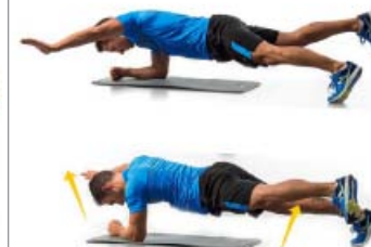
PLANCHA 2 x 20"