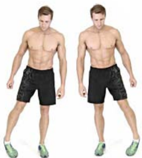
TOBILLOS 10" por pie y sentido