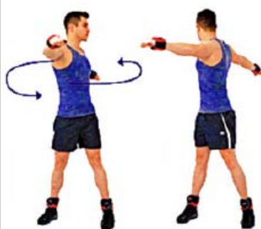
CINTURA CADERA 15" por sentido