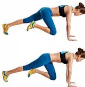
CLIMBER 2 x 16