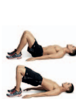
PUENTE HOMBROS 2 x 12 por pierna