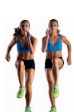
SKIPPING 3 x 20"