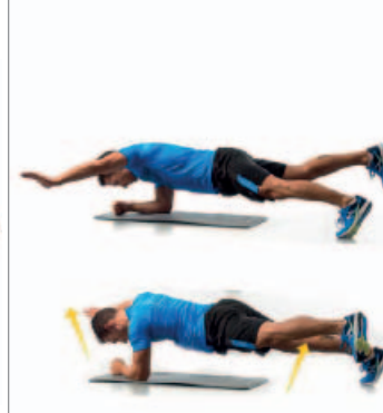
PLANCHA 2 x 20"