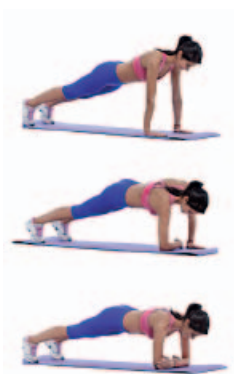
CAMBIO APOYOS 2 x 12