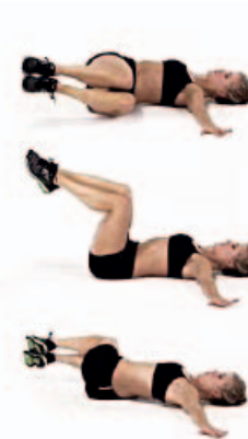
OBLICUOS 2 x 15 por lado