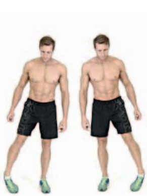
TOBILLOS 10" por pie y sentido