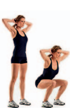
SENTADILLA 2 x 12