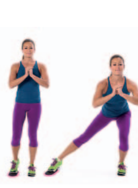
SENTADILLA LATERAL 2 x 12 x lado