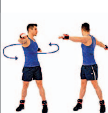
CINTURA CADERA 15" por sentido