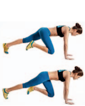
CLIMBER 2 x 16