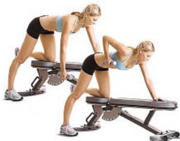
REMO 1 MANO 2 x 10 x mano