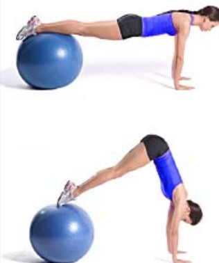
ABS FITBALL 3 x 10