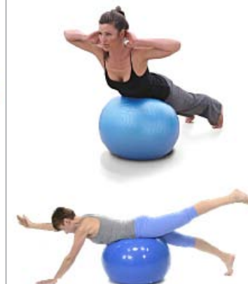
LUMBARES FITBALL 3 X 10