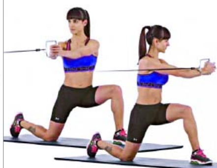
ROTACIONES POLEA O GOMA 3 x 10 x LADO