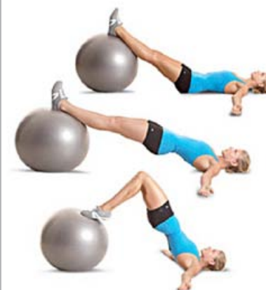
PELVIC CURL 3 x 10