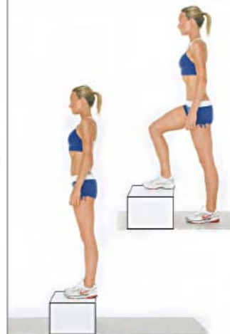
SUBIDAS CAJÓN 2 x 10 por pierna