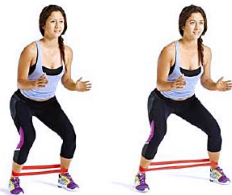
PASOS LATERALES GOMA 2 X 10 X LADO