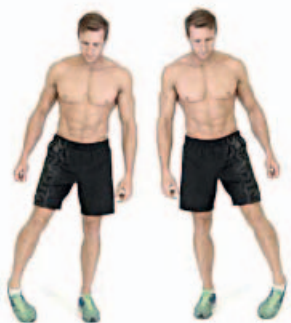
TOBILLOS 10" por pie y sentido