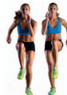
SKIPPING 3 x 20"