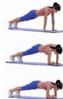
CAMBIO APOYOS 2 x 12