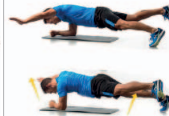
PLANCHA 2 x 20"