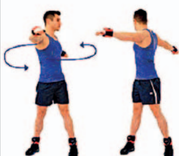
CINTURA CADERA 15" por sentido