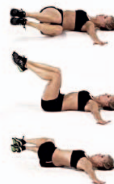
OBLICUOS 2 x 15 por lado