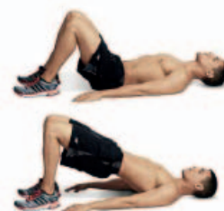
PUENTE HOMBROS 2 x 12 por pierna