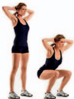
SENTADILLA 2 x 12